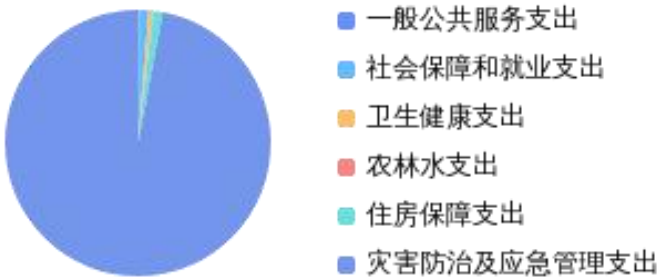
一般公共预算财政拨款支出决算结构情况

2024 年度一般公共预算财政拨款支出年初预算为 46,164,994.90 元，支出决算为 45,950,732.04 元，完成年初预算的 99.54%。其中：