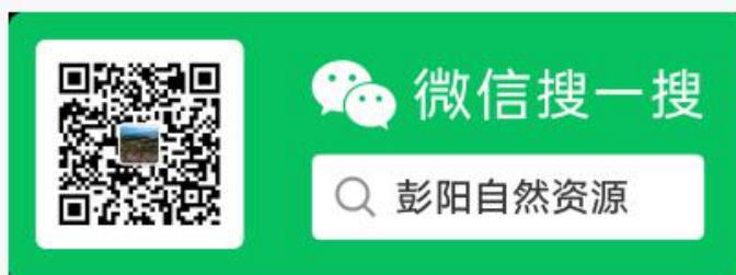
彭阳自然资源微信公众号