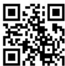
彭阳自然资源政务微博

（四）平台建设情况。 在日常工作中，我局严格按照门户网站信息发布管理制度，加大政府信息发布审核力度，着力提高办事效率和服务水平。严格执行“彭阳自然资源”微信公众平台信息和“彭阳自然资源政务微博”发布管理办法，专人管理运营，规范微信公众号、微博信息发布，做到信息发布及时准确，方便群众查询信息。彭阳县自然资源政务微博开通于 2019 年 11 月 4 日，2019 年共发布信息 57 条；彭阳自然资源微信公众号开通于 2019 年 3 月 11 日，2019 年共发布信息 138 条。