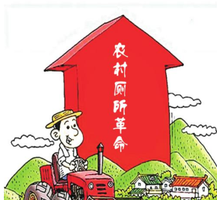
彭阳县2019年农村厕所革命政策图解

解读材料同步，实现正文与解读材料“一对一”链接。五是 加强政务公开宣传 。我局组织认真学习《中华人民共和国政府信息公开条例》，11月8日，我局认真开展了2019年“政府开放日”活动，将农村种养等重点工作对外公开，切实提高干部和群众对政务公开的知晓率，推动农业农村局政务公开工作规范化。